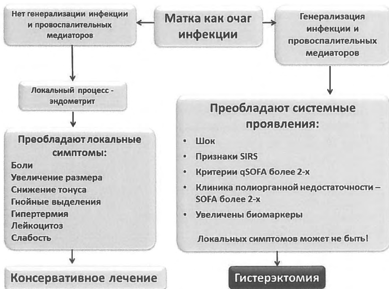
Рис.2. Алгоритм определения тактики санации очага (гистерэктомии) [75].

Раннее выявление признаков системного поражения и манифестации полиорганной недостаточности является ключевым моментом для решения вопроса об оперативном вмешательстве и радикальной санации очага инфекции в акушерстве и гинекологии!