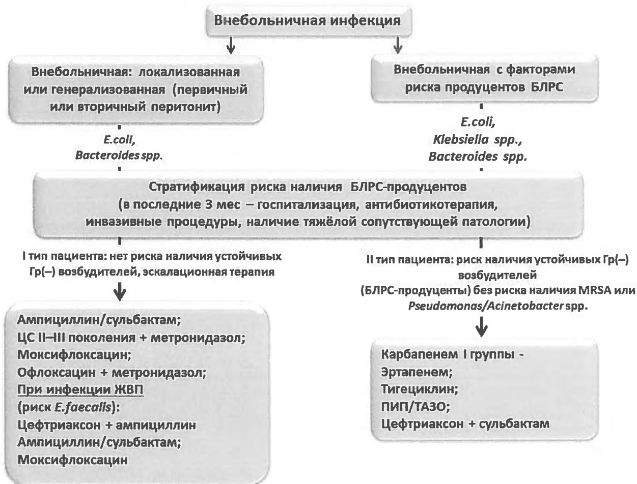
Рис. 4. Эмпирический выбор антимикробной терапии у пациентов с абдоминальной инфекцией с учётом стратификации риска полирезистентных возбудителей