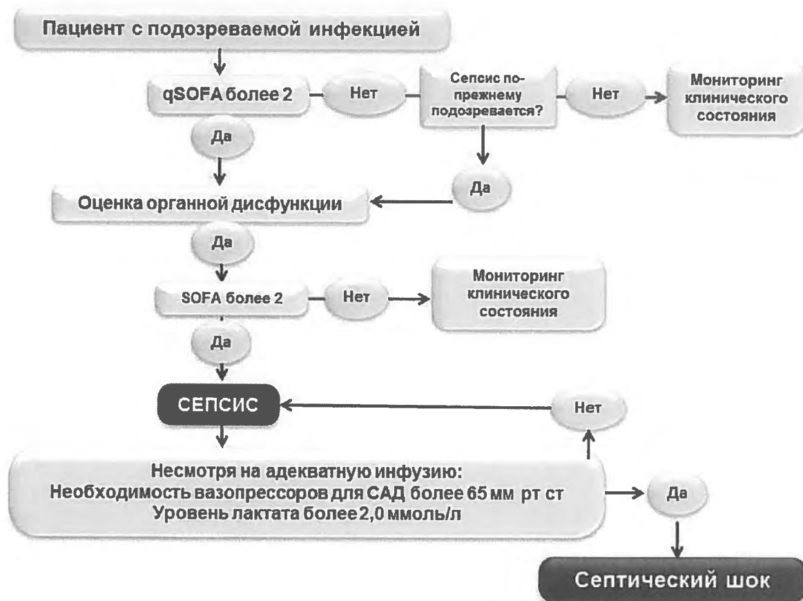
Рис. 1. Алгоритм диагностики сепсиса – «Сепсис 3» [19].