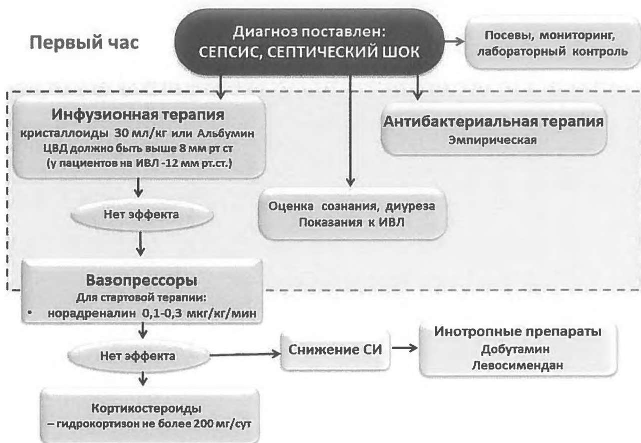
Рис. 3. Начальная терапия сепсиса, септического шока [20]