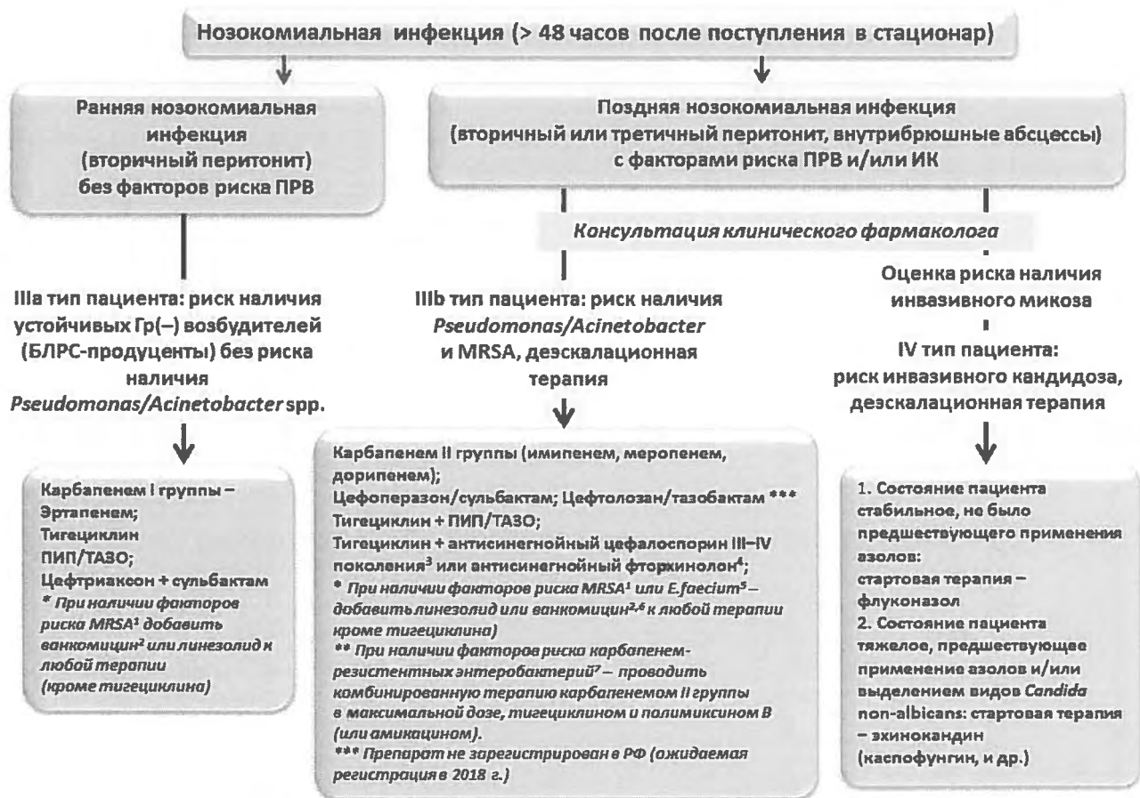
Рис. 5. Эмпирический выбор антимикробной терапии у пациентов с абдоминальной инфекцией с учётом стратификации риска полирезистентных возбудителей и инвазивного кандидоза.